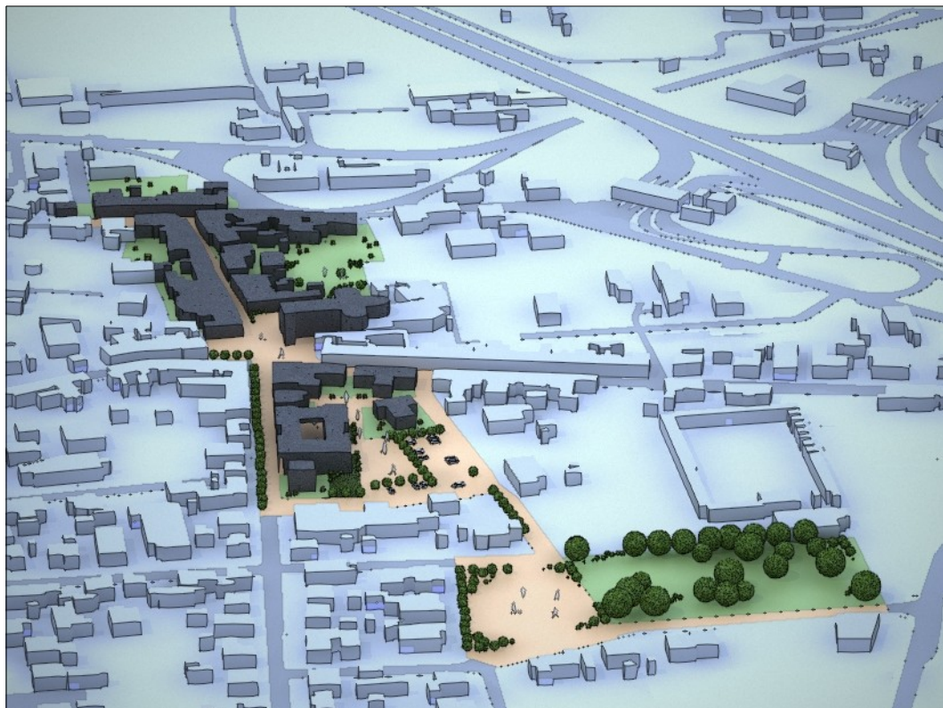
Prefigurazione del comparto dei luoghi centrali