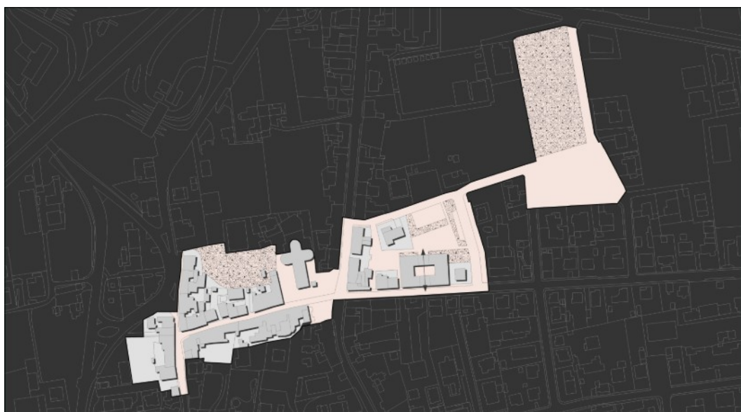
Comparto urbano che individua i "luoghi centrali"

Anche al fine di coordinare gli interventi di cui sopra, l'Amministrazione può attivare un Piano particolareggiato di iniziativa pubblica o pubblico-privata riferito all'intera area. Detto piano deve necessariamente essere redatto successivamente o contemporaneamente al piano del centro storico, formulato con le modalità e gli obiettivi specifici previsti all'Art. 16.