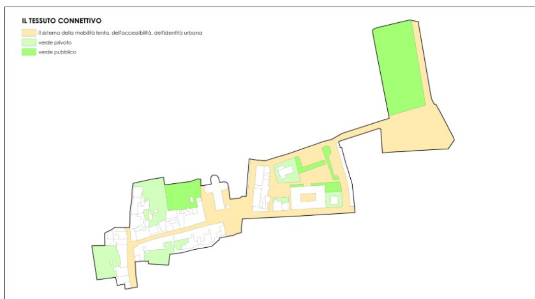
Schema del tessuto connettivo